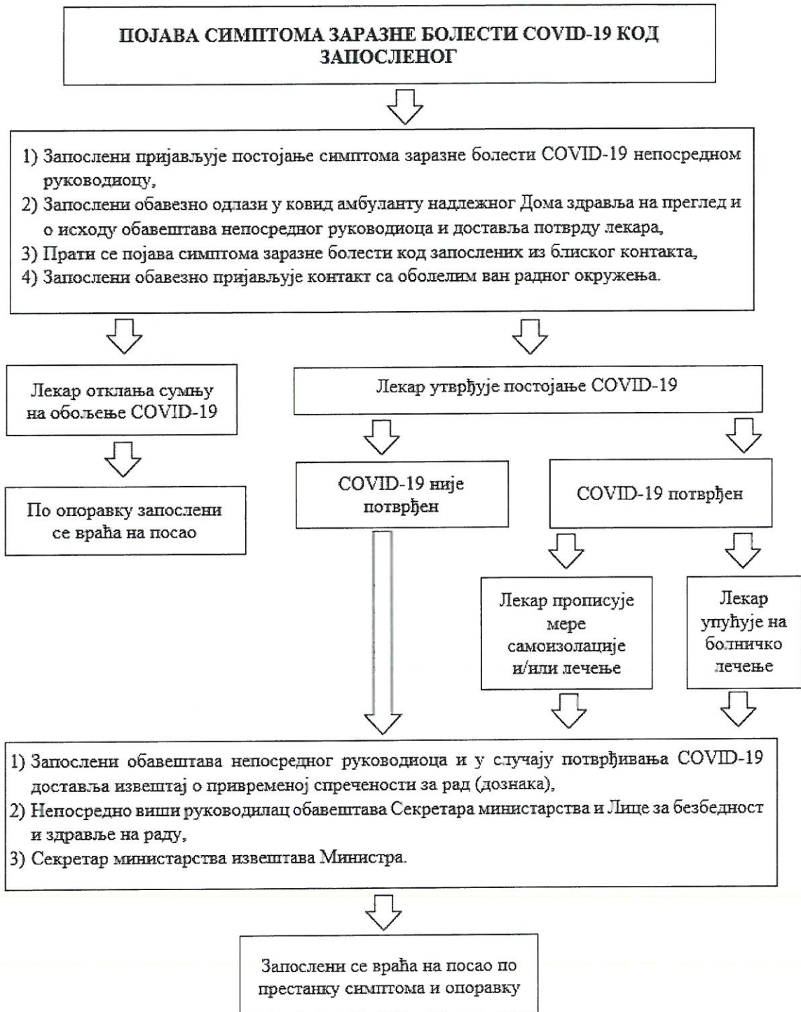
Шема бр. 1: Поступак пријаве симптома и утврђивање COVID-19